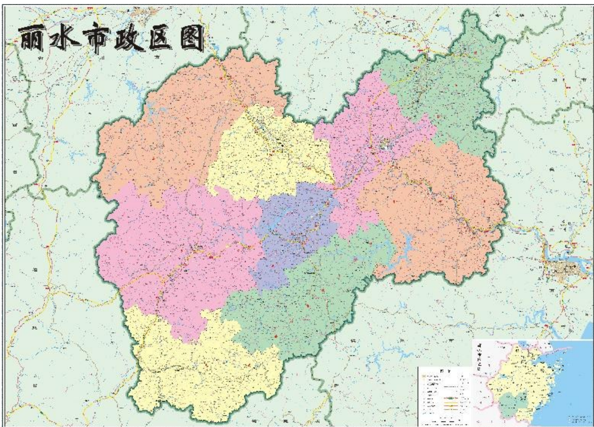
图 2.1-1 丽水市地理位置与行政区划图

辖区总面积1.73万平方公里。全市共有53个镇,90个乡,30个街道,97个社区和2725个行政村。