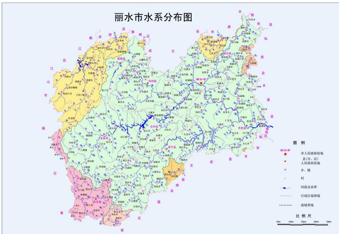
图 2.1-2 丽水市水系分布图

丽水市有瓯江、钱塘江、闽江、赛江、飞云江、椒江等六大水系(如图2.1-2)。瓯江水系为本区域主要水系,流域面积占全市的75.86%,其下为钱塘江、闽江、赛江、飞云江、椒江。