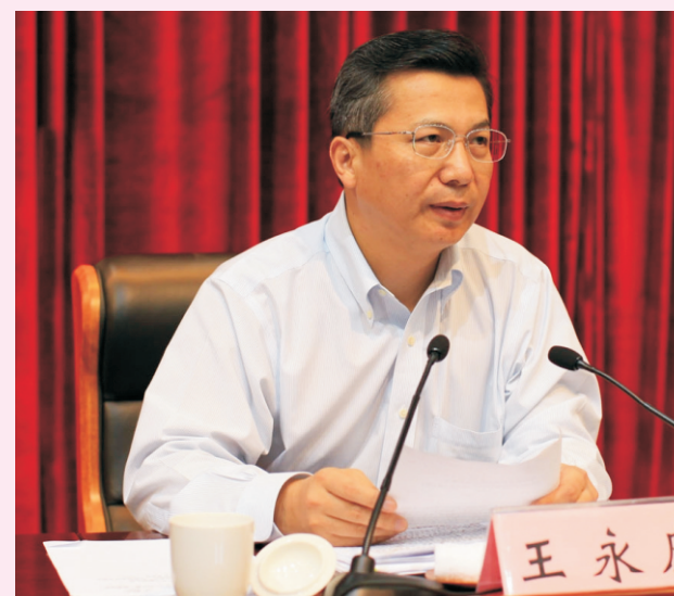
市委副书记、市长王永康在会上讲话

9月19日，全市城市规划建设专题推进会举行。市委副书记、市长王永康在会上强调，要切实加大城市规划建设力度，提升科学规划建设水平，凸显特色，提升品位，加快建设浙西南区域中心城市，打造宜居宜业宜游新丽水。