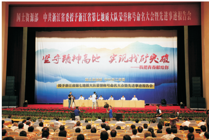
命名大会会议现场