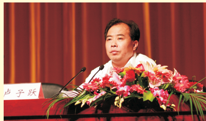
市委书记卢子跃出席会议并作重要讲话