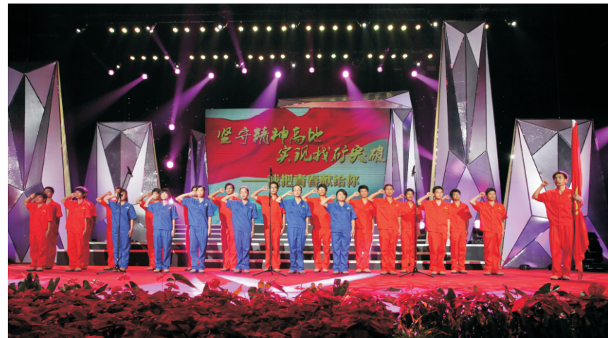
省第七地质大队在命名大会上宣誓