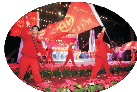
舞动青春，实现突破

丽水市委、市政府在政治上关心省第七地质大队，把省第七地质大队的干部纳入全市干部队伍建设的总体规划；在工作中支持省第七地质大队，鼓励他们发展地质找矿事业；在生活中照顾省第七地质大队，通过常务副市长联系省第七地质大队、召开问题交办会等做法，建立帮扶省第七地质大队的长效机制；在精神上激励省第七地质大队，早在上世纪90年代初，丽水地委就在全市机关干部中开展了跟省第七地质大队的评比活动，大力弘扬地质“三光荣”精神。