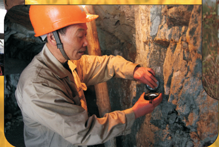
在矿洞内量岩层产状