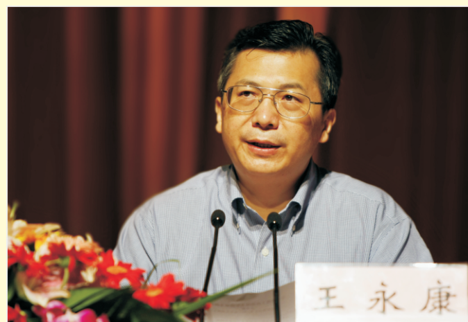
市委副书记、市长王永康主持会议

9月8日，全市教育工作会议在丽水隆重举行。会议总结了“十一五”教育主要工作，认真分析了教育工作面临的机遇和挑战，研究部署了今后五年全市教育重点工作，隆重表彰优秀教师和教育工作者，共庆全国第27个教师节。会议强调，要围绕“十二五”末基本实现教育现代化目标，努力办好人民满意的教育，为丽水经济社会发展提供强有力的人才保证、智力支持和科技支撑。