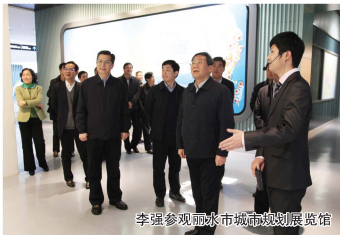
李强参观丽水市城市规划展览馆