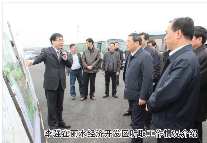
李强在丽水经济开发区听取工作情况介绍

在莲都、景宁、缙云等地，李强走村入户，实地察看指导村庄建设。每到一处，他都强调，要深入发掘和传承农村优秀传统文化和民族文化，充分结合山水自然风光，使农村建筑具有浓郁乡土气息、体现历史文化积淀，打造独具风格的古建筑村落、自然生态村落、民俗风情村落，建设美丽乡村。