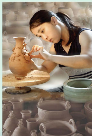
古龙窑青瓷烧制—装饰