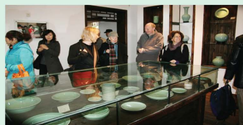
外国陶艺家来龙泉中等职业学校参观学生创作的青瓷作品