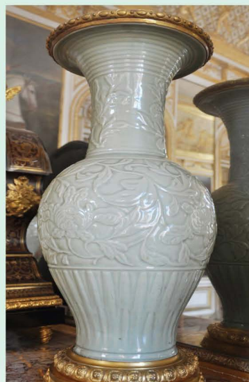
法国巴黎馆藏的元代龙泉青瓷